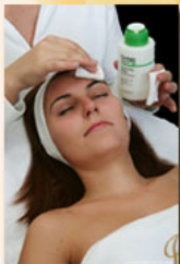
4. Tonizálás Gingko Natural Cleansing Water Alkoholmentes artisztítóvíz-tonik

Alkalmazása (1 adag): A tasak tartalmának 1/3-át langyos vízzel keverjük ki pépesre, kenjük fel egyenletesen a bőrre, majd 15-20 perc múlva a gumszerűen egyben lehúzható maszkot vegyük le.