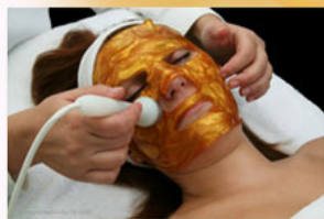
8. Maszk Gold Collagen Face Mask

24 karátos tisztaságú aranylemezkék. Alkalmazása: Végezzünk előmasszírozást a bőrtápláló hidrofíli szezám-kókusz masszázsolajjal. Nedves ecsettel helyezzük fel a bőrre (főleg a ráncos területekre) kb. a tégely 1/5-öd részét. 5-10 perces vapoizos gőzölés közben, vagy után masszírozuk a bőrre. Közben a kezünkkel adagoljunk hozzá vizet. Víz hatására az aranylemezke teljesen oldékonnyá válik és gyönyörűen felszívódik, bejut a bőrre.