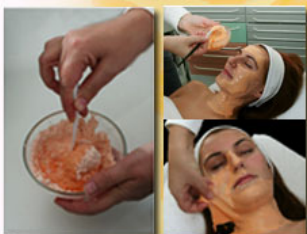
3. Peeling Exfoliating Mask with Papaya Alga alga alapú lehúzható pormaszk.,enzimatiskus peeling.

Alkalmazása (1 adag): A tasak tartalmának 1/3-át langyos vízzel keverjük ki pépesre, kenjük fel egyenletesen a bőrre, majd 15-20 perc múlva a gumszerűen egyben lehúzható maszkot vegyük le.