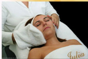
6. Amennyiben ultrahangzselét alkalmaztunk töröljük át a bőrt melegvizes törülközővel.

Alkalmazása: Egy 10ml-es ampulla 1/5 részét (2ml) egy kis víz hozzáadásával masszírozuk a bőrre. A hatóanyagok intenzívebb felszívódását elősegíthetjük, ha ultrahangot alkalmazunk. Ez esetben, a fentebb leírt művelet után pár csepp 24K Gold Skin Care Oil-t (24 karátos aranylemezkéket tartalmazó, bőrtápláló, hidrofíli szezám-kókusz masszázsolaj) vagy ultrahangzselét oszlassunk el a bőrön és ezután ultrahangozzunk.