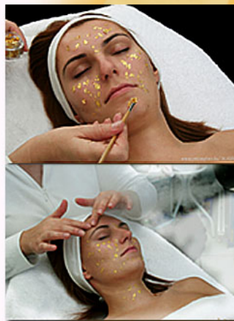
7. Aranylemezkék felhelyezése és bemasszírozása 24 Gold Flakes

24 karátos tisztaságú aranylemezkék. Alkalmazása: Végezzünk előmasszírozást a bőrtápláló hidrofíli szezám-kókusz masszázsolajjal. Nedves ecsettel helyezzük fel a bőrre (főleg a ráncos területekre) kb. a tégely 1/5-öd részét. 5-10 perces vapoizos gőzölés közben, vagy után masszírozuk a bőrre. Közben a kezünkkel adagoljunk hozzá vizet. Víz hatására az aranylemezke teljesen oldékonnyá válik és gyönyörűen felszívódik, bejut a bőrre.